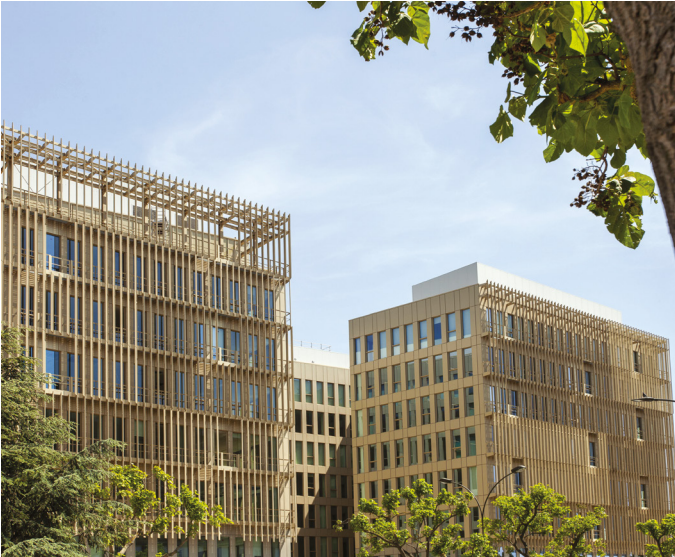
▲ 126-138 avenue de Stalingrad - VILLEJUIF (94)